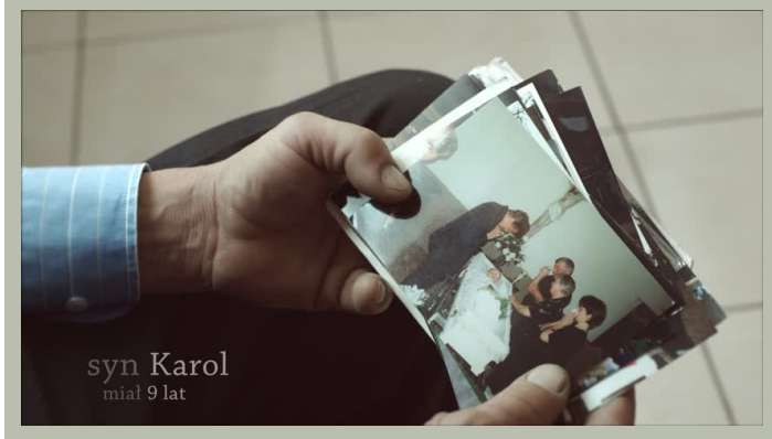
Ministerstwo Transportu Wypadki 1