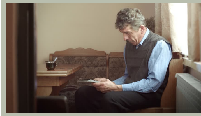
Ministerstwo Transportu Wypadki 2