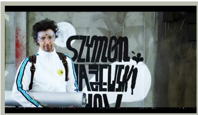
TVN jesienna ramówka