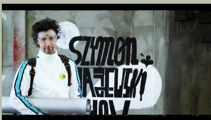
TVN jesienna ramówka