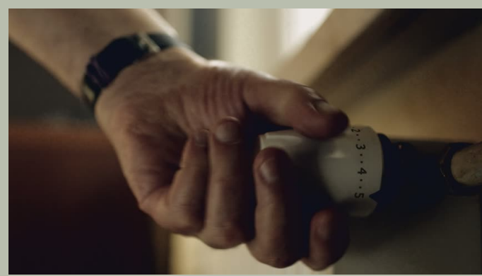
WSZYSTKIE MISKI LewyPrawy