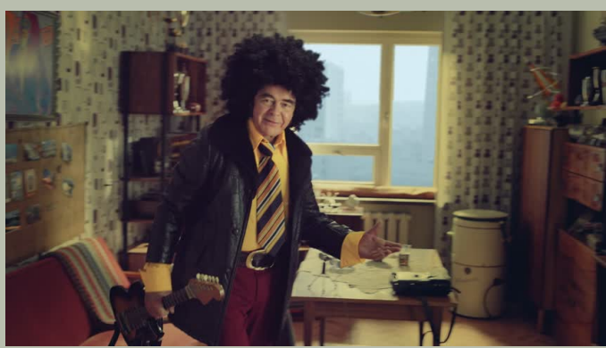
Ministerstwo Środowiska Wszystkie Miśki