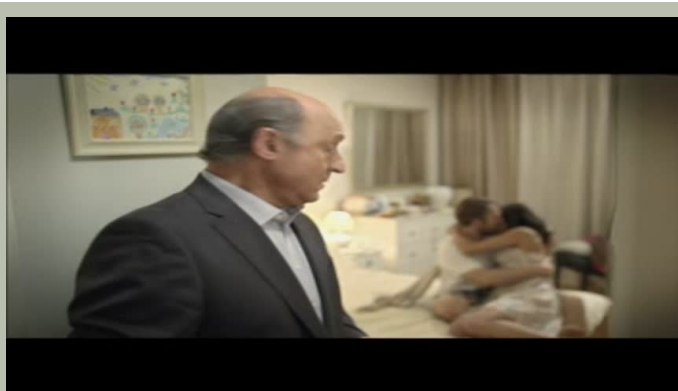
Getinbank Firankowy potwór